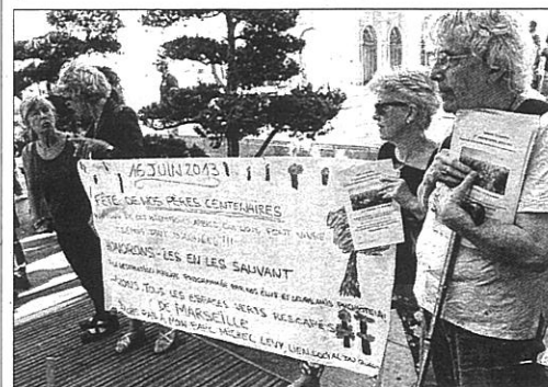
Avant le conseil municipal, des représentants de divers collectifs souhaitant sauver leurs espaces verts ont manifesté.

Lundi matin, bien avant le début du conseil municipal, un collectif représentants diverses associations de Longchamp, Chanterelle, Michel-Lévy, Corderie et "Laisse Béton", soit environ une cinquantaine de personnes, est venu manifester sa colère de façon pacifique.