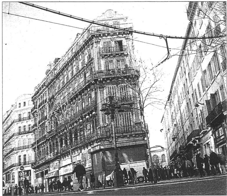
C'est ici que la Ville vient de céder à la Soléam pour 2,5 M€ des bâtiments en vue d'un projet d'hôtel quatre étoiles de 80 chambres, une brasserie, un restaurant, un bar, un espace bien-être...

But de la Ville : restaurer dans l'harmonie cet ensemble architectural et redonner à la Canebière un lustre qui lui fait tant défaut. Pour l'adjointe UMP déléguée au droit des sols, Danièle Servant, "ce tra-